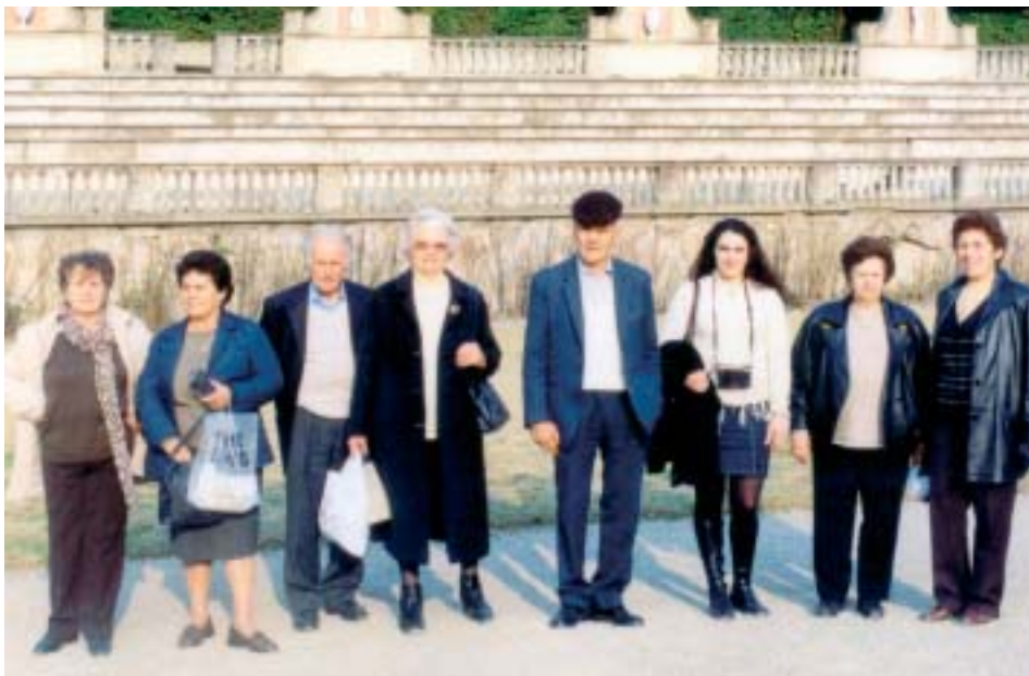
Ouderen uit Paxos in Florence

Het doel van de bijeenkomst - zo vertelde de tutor - was om de groepsleden trots te maken op de resultaten van het Anchise programma en om de plaatselijke gemeenschap te informeren over de doelen, de activiteiten en resultaten van