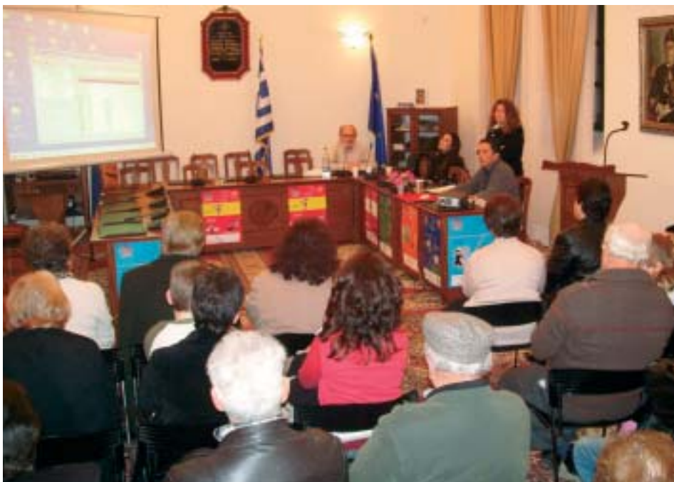
Celebration in the meetingroom of the Paxos municipality

Op de laatste dag wordt een conferentie georganiseerd over hetzelfde onderwerp als waarover in Killingi Nomme wordt gesproken. De delegatie zal vertellen wat men in Killingi Nomme geleerd heeft. Aan het slot wordt een kleine cocktail party georganiseerd met specialiteiten die klaargemaakt worden door mensen uit verschillende Europese landen die in Bretagne wonen.