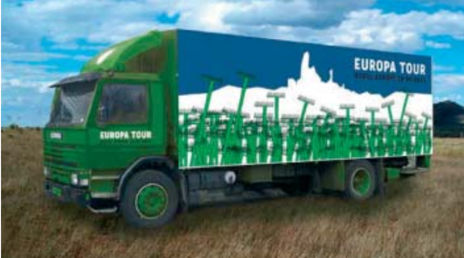
Artist-impression van de 'Tourbus'.

De afsluiting van de Europatour vindt plaats in België, onder de rook van Brussel. De Landbouwcommissaris van de EU heeft toegezegd aanwezig te zullen zijn bij de slotmaaltijd van lokale producten, Tijdens dat diner zal zij de ervaringen van de karavaan horen. Daarna zal het materiaal van de Tour worden uitgewerkt. De Hark zal daarna verschijnen en de resultaten verspreiden.