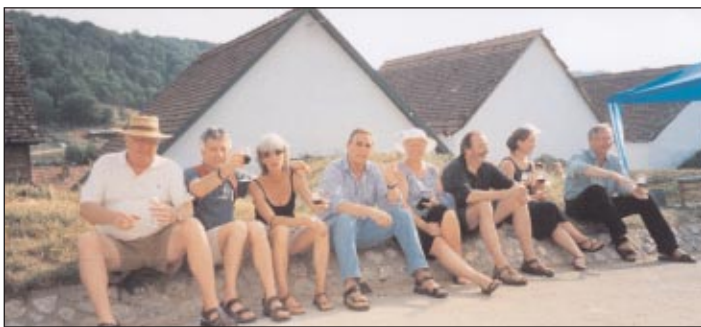
Het wijnfeest van Palkonya op 2e pinksterdag werd een internationale ontmoeting. Gasten uit Wijk aan Zee en Mellionec kwamen naar Palkonya om de nieuwe wijnoogst te proeven.