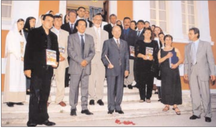
In het midden: De kersverse beschermheer van Cultural Village Konstantinos Stefanopoulos, president van Griekenland.

Paxos is heel voortvarend aan 'zijn' jaar begonnen. Het kleine eiland voor Gaios krijgt een face-lift. De ministers van landbouw hebben het eiland in april met een bezoek vereerd. President Konstantinos Stefanopoulos kwam in mei op bezoek en is van plan de openingsconferentie in april bij te wonen. Hij is bovendien beschermheer van Cultural Village geworden. De conferentie van 16 - 19 april is gewijd aan het thema water. Een wezenlijk probleem van het eiland, want het heeft geen bronnen en is geheel en al afhankelijk van wat er uit de lucht komt vallen.